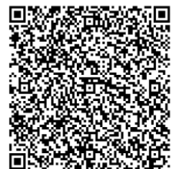
Termin im iCal-Format

Zielgruppe: Geowissenschaftler/innen und Studierende der Geowissenschaften Teilnehmerzahl: max. 15 Termin: Donnerstag, 21. Mai 2015, 12.00 – 13.30 Uhr (s.t.) Ort: Erwin-Schrödinger-Zentrum, Rudower Chaussee 26, Raum 0`315